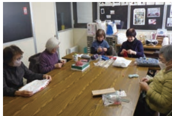
いざなり会 (手仕事)