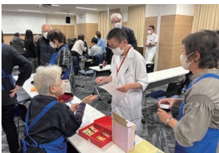
11月18日 市立病院喫茶リボン