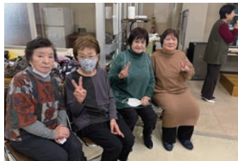
カラオケ・ダンスサークル