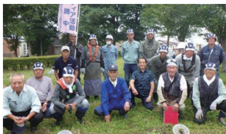
8月29日 遊園通り草刈り

シルバー人材センターの目的の1つである、地域貢献活動の一環であるボランティア活動を行いました。3つのボランティアに延べ41名の会員さんに参加いただき、遊園通り草刈・東明公園剪定では美唄市の美しきまちづくりサポーターとして、街の景観美化と道内有数の桜の名所の維持にご協力いただきました。また、小学5年生・保育園・幼稚園の稲刈り体験ボランティアでは、子供たちとのふれあいに皆様の笑顔が印象的でした。ご協力いただきました皆様ありがとうございました。今後もボランティア活動は積極的に行っていきたいと思いますので、皆様のご協力お願いいたします。