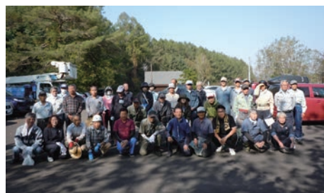
10月4日 東明公園剪定