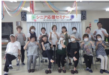
6月24日 シニア応援セミナー