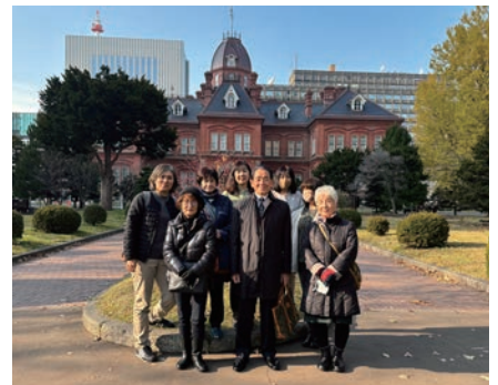
11月25日 リボンの会札幌視察