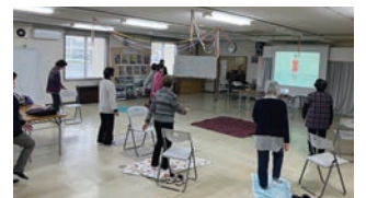
ぴんとしゃん教室

これまでも各種講習会や交流会の開催を続けてきましたが、昨年は市役所高齢福祉課の協力をいただき、市立美唄病院での喫茶リボンやセンターでの出張オレンジカフェ・ぴんとしゃん教室など、センターだけでなく、他団体との交流を進めてきました。また、サークル活動を通してお友達紹介で入会して下さる会員さんも増えており、皆様の紹介が大きな力になっていると実感しております。ありがとうございます。皆様の協力により12月末時点39名の会員さんに入っていただいております。今後も会員の皆様・役職員が一丸となって、市民の方にシルバー人材センターを知っていただく企画をしていきたいと思っておりますので、皆様のご協力よろしくお願いいたします。