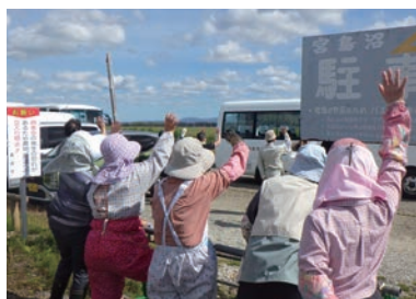
9月24日 ピパの子保育園稲刈り