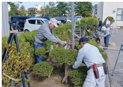
10月3日 冬囲い講習会