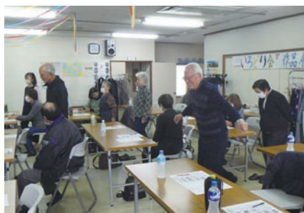
11月20日 健康管理講習