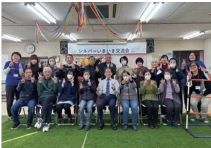
2月20日 いきいき交流会

シルバー人材センターでは様々な講習会や納涼会などいろいろな活動をしています。お友達との参加も可能ですので、ぜひ皆さんも参加してみませんか？今年もいろいろな企画をしていますので、みなさまのご参加お待ちしております。